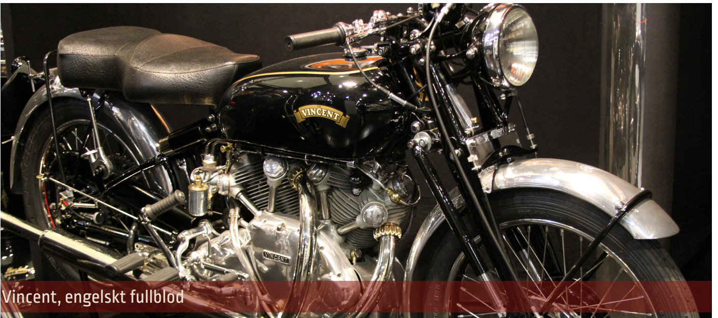
Vincent, engelskt fullblod