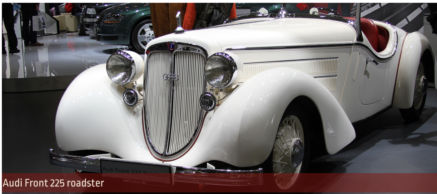
Audi Front 225 roadster