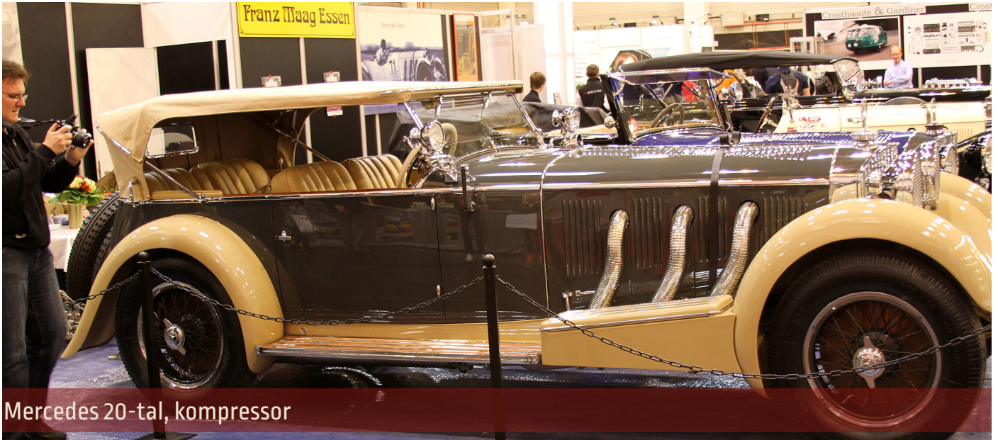
Mercedes 20-tal, kompressor