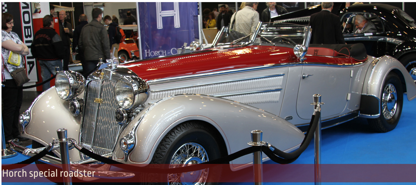
Horch special roadster